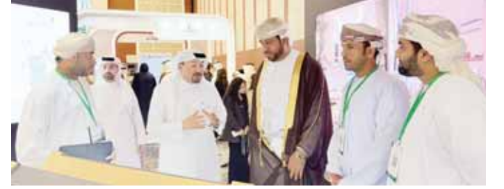
العمانية - العمانية

كفاءة استهلاك الموارد وتعزيز مستويات الراحة والأمان، وأثر التخطيط الحضري ومشروعات الاستدامة البيئية في تعزيز الصحة العامة، والتحول البيئي المستدام في إطار رؤية «عُمان 2040»، إلى جانب مبادرة شمال الباطنة الخضراء في مجال الاستدامة البيئية والتشجير وتعزيز البنية الأساسية الخضراء.