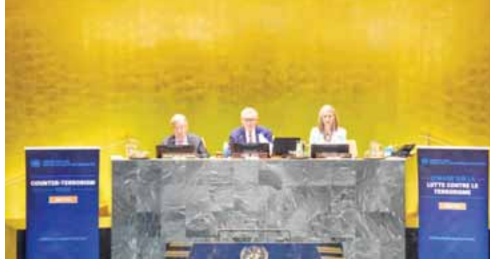
نيويورك - العمانية

لرؤساء الوكالات والهيئات الوطنية المعنية بمكافحة الإرهاب في الدول الأعضاء، تحت شعار «مستقبل خالٍ من الإرهاب»: تعزيز الالتزام العالمي بنهج يشرك أطرافاً متعددة في مكافحة الإرهاب، وذلك من خلال قيادة الدول الأعضاء وتحركاتها». ودعا معالي أنطونيو غوتيريش الأمين العام للأمم المتحدة، في كلمة ألقاها أمام المؤتمر، إلى تعزيز الجهود الدولية لمكافحة الإرهاب من خلال التركيز على الوقاية، وتوسيع التعاون بين الدول، والاستفادة من التقنيات الحديثة، مع التمسك بحقوق الإنسان وسيادة القانون، مؤكداً أن الإرهاب يشهد تطوراً مستمراً، الأمر الذي يتطلب تطوير آليات التصدي