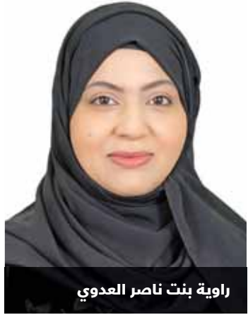
راوية بنت ناصر العدوي

تشغيلي منضبط وأطر تنظيمية واضحة. وقالت راوية بنت ناصر العدوي مدير عام تنظيم الطيران المدني إن هيئة الطيران المدني تضطلع بدورها التنظيمي