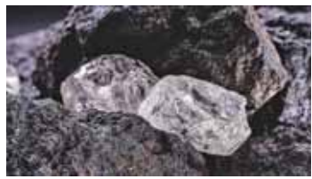
لندن - الغمانية

خصّصت بريطانيا 50 مليون جنيه إسترليني، ما يعادل نحو 66 مليون دولار، لتعزيز الإنتاج المحلي من المعادن الحيوية، في خطوة تهدف إلى تقليل الاعتماد على سلاسل الإمداد العالمية المركزة وتعزيز قدرة الاقتصاد على مواجهة الاضطرابات. وسيتم تخصيص التمويل لدعم مشاريع تشمل استخراج المعادن ومعالجتها وإعادة تدويرها، وهي مواد تدخل في صناعات متعددة، من الهواتف الذكية والتلاجات إلى بطاريات السيارات الكهربائية.