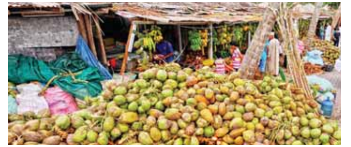
مسقط - ح

من الرطوبة الجوية وكمية مناسبة من الأمطار بالإضافة إلى الجو الدافئ للنمو وتوجد أصناف عديدة للنارجيل تزيد على 80 صنفًا ومعظم الاختلافات بين الأصناف عبارة عن اختلافات بيئية حدثت عن طريق تأقلم هذه الأصناف في بيئات زراعية مختلفة وتقع أغلب مزارع محصول النارجيل في محافظة ظفار في السهول الساحلية لتوفر الظروف المناخية الملائمة لزراعة ونمو أشجار النارجيل. وقد نفذت وزارة الثروة الزراعية والسمكية وموارد المياه العديد من المشاريع والبرامج لتطوير زراعة محصول النارجيل في ولايات محافظة ظفار من خلال إجراء العديد من البحوث والدراسات العلمية عن محصول النارجيل وتوزيع شتلات أشجار النارجيل على المزارعين في ولايات المحافظة وتشجيع المزارعين على زراعة النارجيل في مزارعهم وتفتيح مشروع إجلال أشجار النارجيل المعمرة في مزارع ولايتي صلالة وطاقة وتنفيذ برامج مكافحة الآفات الزراعية التي تصيب أشجار النارجيل.