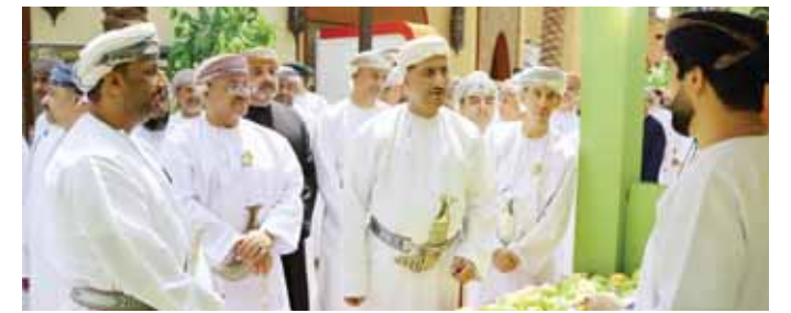
صالح - الغمالية

انطلقت أمس بولاية صحار بمحافظة شمال الباطنة فعاليات مهرجان المانجو لعام ٢٠٢٦م، الذي ينظمه مكتب وادي صحار بالتعاون مع المديرية العامة للثروة الزراعية والسمكية وموارد المياه بشمال الباطنة، وبمشاركة عدد من المزارعين من مختلف ولايات المحافظة، ويستمر ثلاثة أيام رعي انطلاق المهرجان، سعادة محمد بن سليمان الكندي محافظ شمال الباطنة، ووضوح سعادة الشيخ سعود بن محمد الهنائي، والي صحار، أن تنظيم المهرجان يأتي في إطار الجهود الرامية إلى دعم القطاع الزراعي، وتعزيز مكانة محصول المانجو الغماني، وإبراز جودة وتنوع الإنتاج الزراعي بالمحافظة، وبشراكة مع المزارعين والأسر المنتجة على تسويق منتجاتهم، وفتح أفق جديدة للترويج للمنتجات المحلية، ويشهد المهرجان مشاركة واسعة من المزارعين والمنتجين، إذ يضم ٤٥ ركنًا لعرض أصناف متنوعة من المانجو المتنجات والمنتجات المرتبطة به، إلى جانب دعم المزارعين وتعزيز استدامة القطاع الزراعي.