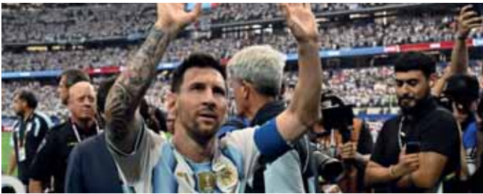
دانس - وكالات

هدفيه السابع عشر والثامن عشر في البطولة، لينفرد بصدارة الهادفين التاريخيين للمسابقة العالمية، ويضيف إنجازاً جديداً إلى مسيرته الحافلة بالأرقام القياسية. ولم يكن التألق التهديفي لميسي هو الحدث الوحيد في المباراة، بل جاءت أهدافه لتمنحه مجموعة جديدة من الأرقام التي تؤكد استمراره في إعادة رسم حدود الإنجاز داخل أكبر بطولة كروية على مستوى المنتخبات، وأهدر ميسي ركلة جزاء في المباراة.