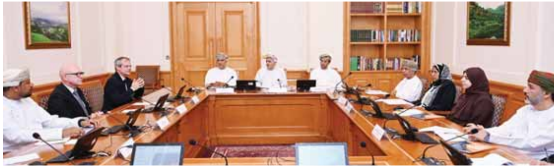
مسقط - ش

عقدت اللجنة الفرعية المنبثقة من لجنة التقنية والابتكار بمجلس الدولة امس الثلاثاء والمشكلة لدراسة «تسخير التقنية في الإدارة المستدامة للمياه في سلطنة عُمان»، اجتماعها السادس لدور الانعقاد العادي الثالث من الفترة الثامنة، برئاسة المكرم السيد زكي بن هلال البوسعيدى رئيس اللجنة، وبحضور المكرمين أعضاء اللجنة. واستضافت اللجنة خلال الاجتماع ممثلي المؤسسة العامة للمناطق الصناعية «مدائن» وشركة تحلية مياه الشرب «فيوليا»؛ للاستئناس بمبرياتهم والأخذ بملاحظاتهم حول الدراسة بما يساهم في إثراء الجوانب الفنية والتطبيقية المرتبطة بإدارة الموارد المائية، وتوظيف التقنيات الحديثة؛ لرفع كفاءة استخدامها واستدامتها. وخلال استضافتها ممثلي المؤسسة العامة للمناطق الصناعية «مدائن» استعرضت اللجنة واقع استخدام المياه في المناطق الصناعية، وتناولت آليات التعامل مع المياه