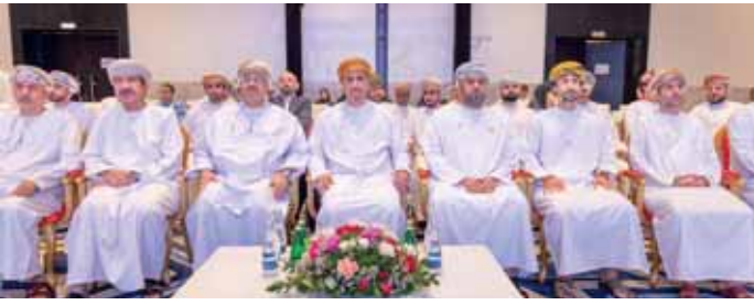
صحار - الفهانية

نُظِم الإثنان بولاية صحار بمحافظة شمال الباطنة لقاء متخصص بعنوان «التحول إلى الطاقة المتجددة: خيار اقتصادي واستراتيجي لقطاع الأعمال في صحار»، تحت رعاية سعادة محمد بن سليمان الكندي محافظ شمال الباطنة، بمشاركة ممثلين من الجهات الحكومية والقطاع الخاص والمستثمرين والمهتمين بقطاع الطاقة. ويأتي تنظيم اللقاء من قبل شركة جلوبال للأنظمة الكيميائية والصيانة المحدودة بالتعاون مع مدينة صحار الصناعية (مدائن)، وشركة جيبس للخدمات الصناعية، وشركة لوني، في إطار دعم التوجهات الوطنية الرامية إلى تعزيز استخدام مصادر الطاقة المتجددة وتحقيق مستهدفات رؤية عُمان 2040 وخطط الحياد الصفري الكربوني بحلول عام 2050. وقال المهندس عبدالله بن محمد اللواتي، مدير عام شركة جلوبال للأنظمة الكيميائية والصيانة المحدودة: إن اللقاء يهدف إلى تعزيز الوعي بأهمية التحول نحو الطاقة المتجددة واستعراض أحدث التقنيات والحلول المتكيفة في هذا المجال، إلى جانب مناقشة الفرص الاستثمارية والعودة الاقتصادية المرتبطة بها، وفتح آفاق جديدة للتعاون والشراكة بين مختلف الجهات ذات العلاقة، وأضاف أن اللقاء استقطب أكثر من 50 جهة صناعية وتجارية، وسعى إلى تمكين المشاركين من الاطلاع على التجارب الناجحة في مجال الطاقة المتجددة، وتعزيز تبني الحلول المستدامة في المحافظة.