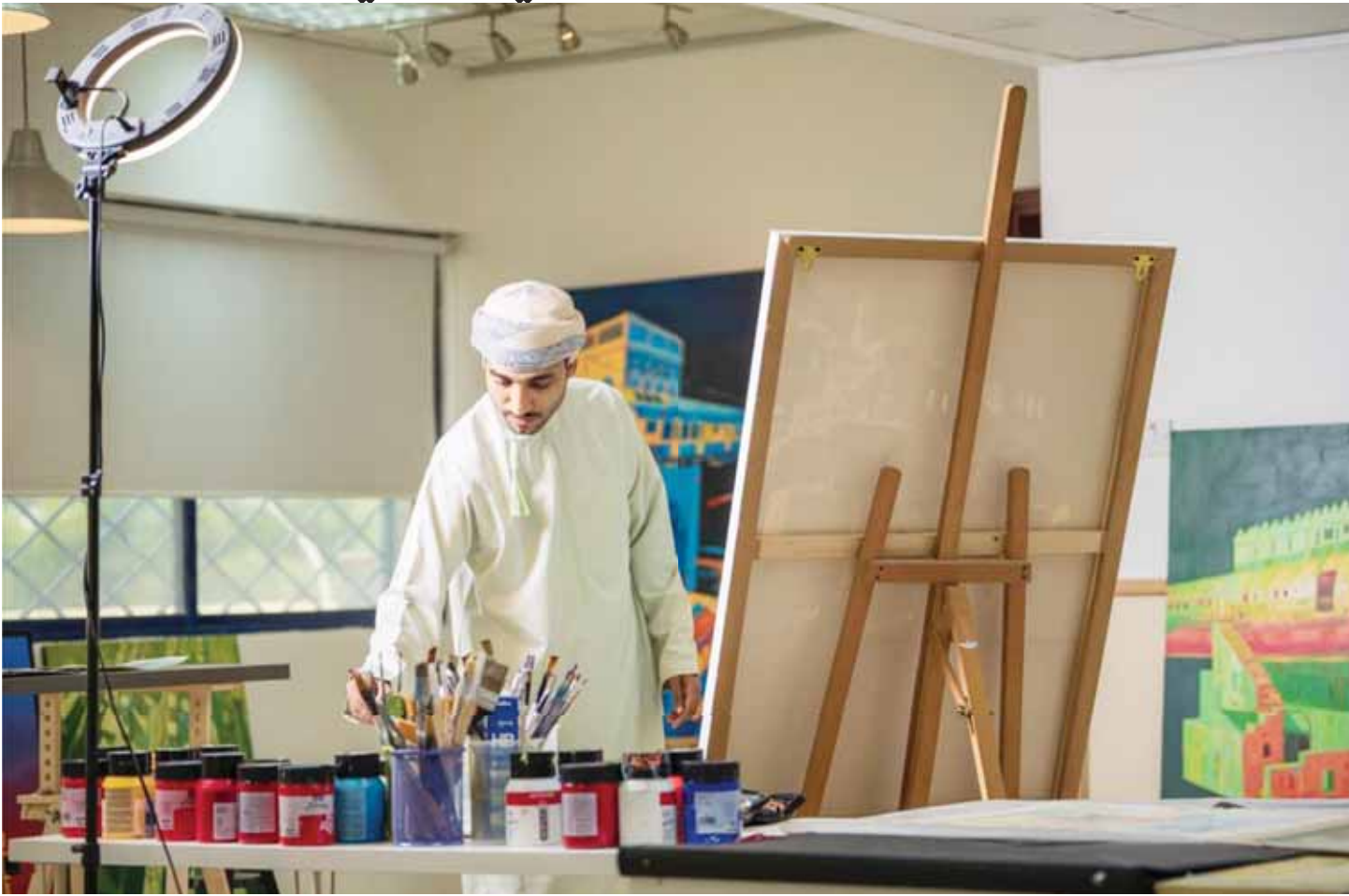
مسقط - العمانية

تعدُّ الهوايات الشخصية ظاهرة إنسانية تتجاوز حدود الترفيه التقليدي، فهي ركيزة أساسية لتحقيق التوازن النفسي والنمو الذاتي، وفي الوقت الراهن المعاصر الذي تسطر عليه المعايير والتوجهات المادية ولغة الأرقام، تبرز أهمية العودة إلى تلك المساحات التي من الممكن أن نطلق عليها بالوجدانية - إن صح التعبير - فهي تمنح الفرد فرصة للتخلص من ضغوطات اللحظة المُتسارعة، فهذه الهوايات هي الملأ المحكم الذي يُعيد ترتيب الفوضى داخل الإنسان، حيث تساعد على إعادة نسج العلاقة بينه وبين ذاته، وتوجد هوية شخصية ذات معنى حقيقي، بعيدًا عن ضجيج الحياة اليومية، فلا تُصبح الهواية مجرد رفاهية، بل ضرورة خفية يحتاجها الإنسان.