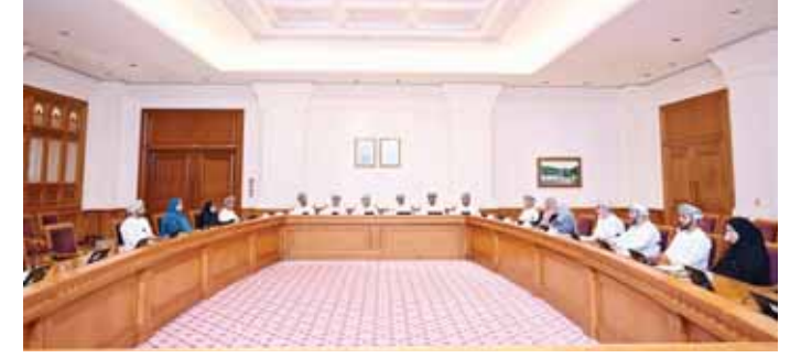
مسقط - ش

أثر دخول مؤسسات التعليم العالي الخاصة في التصنيفات العالمية، ومنها تصنيف (QS) العالمي في تعزيز السمعة الأكاديمية وزيادة قدرتها التنافسية على جذب الطلبة محلياً ودولياً إلى جانب دوره في توسيع الشراكات العلمية والبحثية مع المؤسسات الأكاديمية الدولية. واستعرضت اللجنة واقع التشريعات واللوائح المنظمة لمؤسسات التعليم العالي الخاصة ومدى إسهامها في تعزيز مبادئ الحوكمة إلى جانب طرح توصيات لتطوير البيئة التشريعية، كما بحثت مع ممثلي الجامعتين مدى الاستفادة من التجارب الدولية في تنوع مصادر التمويل بعيداً عن الاعتماد على الرسوم الدراسية عبر الأوقاف والاستثمارات والشراكات، وآليات حوكمة هذه الموارد؛ لضمان استدامتها وعدم تعارضها مع الرسالة الأكاديمية. وأكدت اللجنة خلال الاجتماع أهمية تطوير الأطر التنظيمية، وتعزيز الشراكات مع مختلف القطاعات بما يساهم في تعزيز جودة التعليم العالي الخاص، وتحقيق مستهدفات التنمية الوطنية و«رؤية عمان 2040».