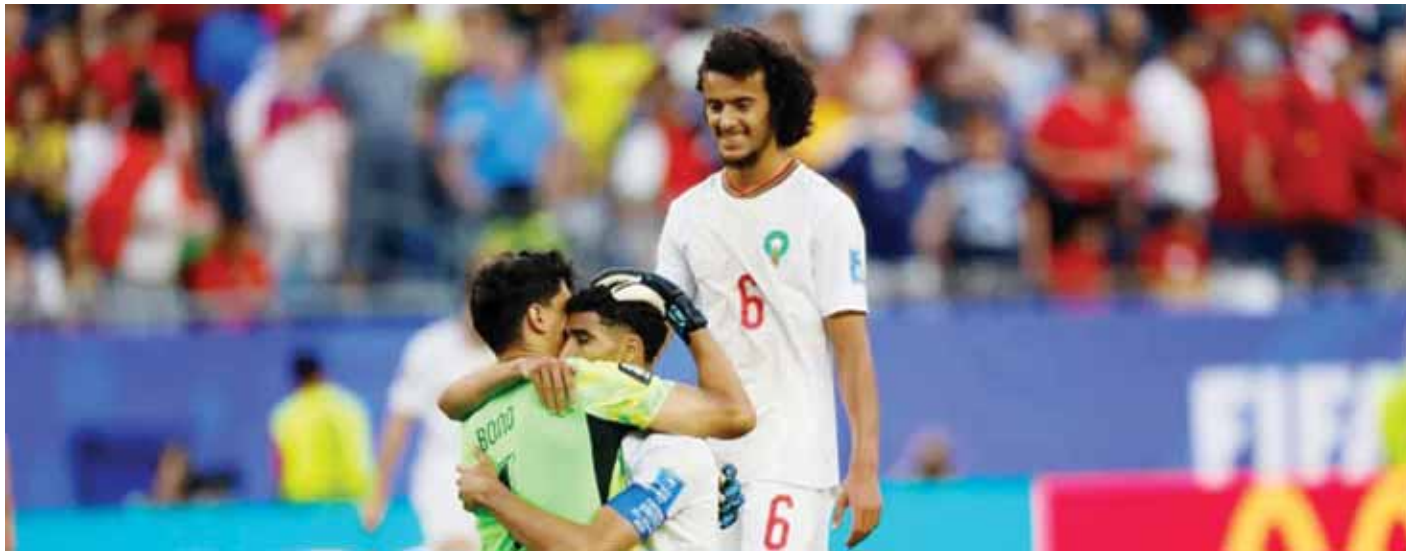
فانكوفر