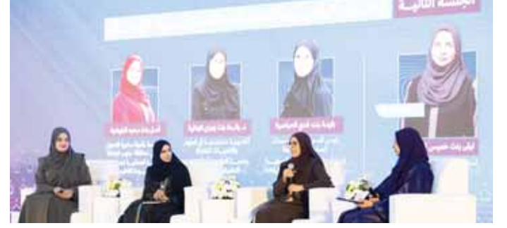
بركة - الغمالية

ناقش ملتقى «ريادة الأعمال في التحوّل الرقمي - بولاية بركاء، أهمية التحوّل الرقمي في دعم نمو الأعمال وتطوير بيئات العمل الحديثة، وتعزيز قدرة المؤسسات الصغيرة والمتوسطة والمشروعات الريادية على الاستفادة من التقنيات الرقمية، بما يسهم في رفع الكفاءة التشغيلية، وتحسين تجربة العملاء، وتعزيز القدرة التنافسية واستدامة النمو. جاء ذلك خلال أعمال الملتقى الذي نظّمته أمس غرفة تجارة وصناعة عُمان بمحافظة جنوب الباطنة، تحت رعاية المكرمة الدكتوراة شمس بنت مسعود الشيبانية عضو مجلس الدولة. وتضمن الملتقى غلّسطين نقاشيتين، جاءت الأولى بعنوان «تمكين رواد الأعمال في ظل التحوّل الرقمي»، وناقشت سبل الاستفادة من التقنيات الرقمية في تطوير المشروعات الريادية وتعزيز جاهزية رواد الأعمال لمواكبة متطلبات التحوّل الرقمي، فيما جاءت الثانية بعنوان «التحوّل الرقمي بين التحديات والفرص لرواد الأعمال»، وتطرقت إلى واقع التحوّل الرقمي في بيئة الأعمال، وأبرزت الفرص والتحديات المرتبطة بتبني الحلول الرقمية ودورها في دعم نمو واستدامة المشروعات. كما تضمن الملتقى تقديم ورقتي عمل متخصصتين، الأولى قدمتها الدكتورة شونة بنت محمد البرواني الرئيس التنفيذي لشركة مترو مسقط بعنوان «أهمية التحوّل الرقمي في تعزيز ريادة الأعمال»، فيما قدمت الورقة الثانية،