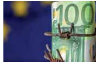
فرانكفورت - وكالات

تراجعت توقعات المستهلكين في منطقة اليورو لمعدل التضخم خلال العام المقبل، بشدة حتى قبل التوصل إلى اتفاق لوقف الحرب بين الولايات المتحدة وإيران.