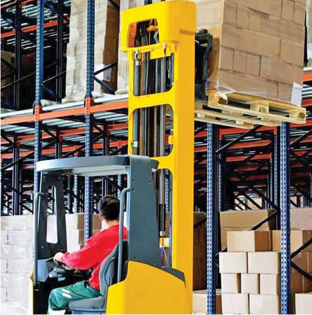
133 مليون ريال عُماني، وتواصل وزارة التجارة والصناعة وترويج الاستثمار، ممثلة في «صادرات عمان»، تنفيذ برامج ومبادرات تستهدف رفع الشركات الوطنيّة للتوسع في الأسواق الاقتصادية.

وتؤكد هذه المؤشرات على استمرار تنامي حضور المنتج العماني في الأسواق الدولية، مدعوماً بجودته وفنائه التنافسية والجهود الحكومية المتواصلة لتعزيز الصادرات الوطنية وتوسيع الشراكات التجارية وفتح أسواق جديدة، بما يدعم مُستهدفات التنويع الاقتصادي والاستدامة الاقتصادية.