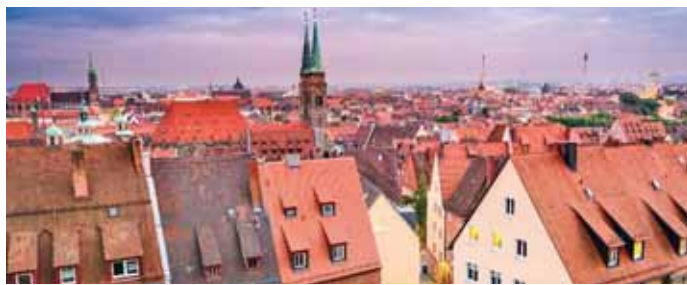
برلين - وكالات

نمو الأسعار في أكبر سبع مدن ألمانية، وهي برلين وهامبورغ وميونخ وكولونيا وفرانكفورت وشوتغارت وديسلدورف، عند 0.3% فقط، أما في المناطق الريفية ذات الكثافة السكانية المرتفعة، فقد تراجع أسعار الشقق بنسبة 0.4%، وفقاً لوكالة الأنباء الألمانية «د ب أ». وفيما يتعلق بالمنازل المخصصة لأسرة واحدة أو أرستين، سجلت المدن الكبرى أكبر زيادة في الأسعار بنسبة 1.4%، العام نفسه. وأتسعت الفوارق الإقليمية في تطور الأسعار؛ ففي المناطق الريفية منخفضة الكثافة السكانية بنسبة 0.8%، وبالمقارنة مع الربع الأخير من عام 2025، ارتفعت الأسعار بنسبة 0.3% فقط.