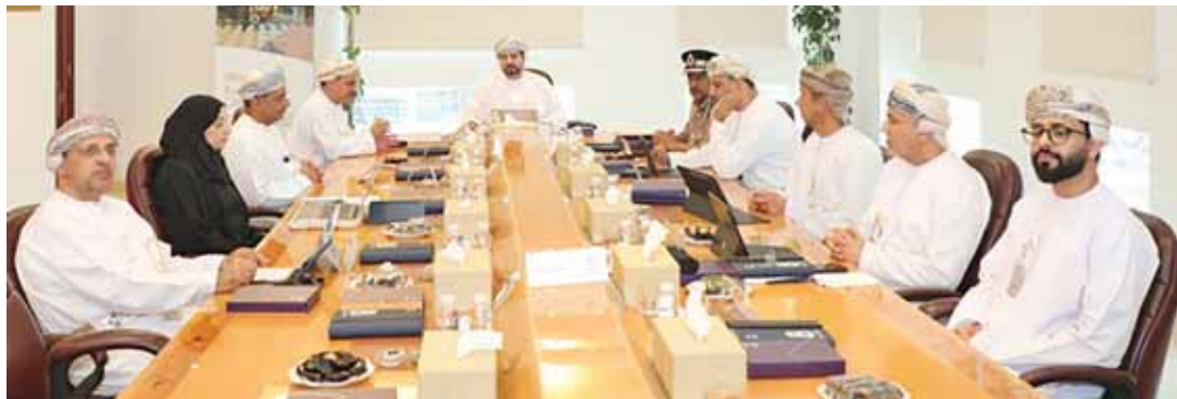
مسقط - العماني