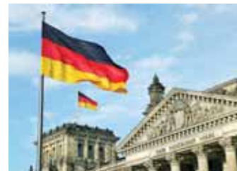
برلين - الألمانية

ارتفعت ديون القطاع العام في ألمانيا بنهاية الربع الأول من العام الجاري بنسبة 2.4 بالمائة مقارنة بالربع السابق، لتصل إلى 2.7265 تريليون يورو، وفقاً لبيانات صادرة عن مكتب الإحصاء الاتحادي الألماني.