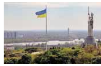
جاندانسك - الألمانية

أعلنت رئيسة الوزراء الأوكرانية، بوليا سفيريدينكو، الخميس، خلال مؤتمر تعافي أوكرانيا الذي التقت خلاله برئيس البنك الدولي، أي جي بانجا، عن أن أوكرانيا ستلتقى بمساعدات إضافية بقيمة 3.39 بليون دولار من البنك الدولي.