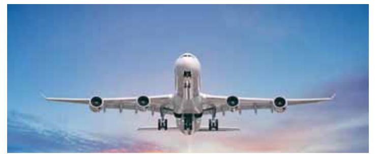
واشنطن - وكالات

دون مستوى 74 دولاراً للبرميل، وسط مؤشرات على استئناف حركة ناقلات النفط عبر مضيق هرمز، الذي يمر عبره نحو خمس الإمدادات النفطية العالمية. فيما تراجع أسهم شركات التكنولوجيا، مما زاد التركيز على نتائج شركة (ميكرون) التكنولوجية المتخصصة في صناعة الرقائق الإلكترونية، والمقرر إعلانها بعد إغلاق السوق. وكان السهم قد قفز بأكثر من 200% في عام 2026، لكنه تراجع يوم الأربعاء. وتراجع سهم شركة سيربيراس سبستيمز بعد أن توقعت الشركة، في تقريرها الأول بعد طرح أسهمها للاكتتاب العام، انخفاض هوامش أرباحها السنوية إلى ما دون أرقام الربع الأول.