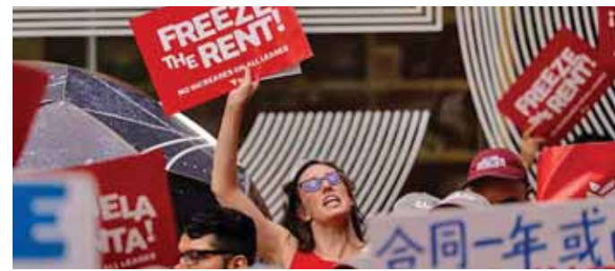
نيويورك - وكالات

هذا هو الارتياح الذي يستحقه العاملون في أنحاء مدينتنا. كان التصويت ختام طقس سنوي يدوم لأسابيع لتحديد الزيادة التي يمكن للملاك فرضها على إيجارات الشقق الخاضعة لنظام استقرار الإيجارات، والتي يسكنها نحو ربع سكان نيويورك. وباخذ المجلس في الاعتبار عوامل تشمل الأجور والتضخم وتكاليف الصيانة والضرائب ودخل الملاك. وبلغ متوسط الإيجار الشهري للشقة الخاضعة للتتظيم 1599 دولاراً، وفقاً لدراسة المجلس لعام 2025، في مدينة يبلغ فيها متوسط إيجار الشقة المؤجرة حديثاً 3950 دولاراً.