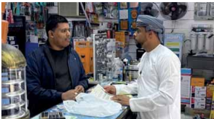
مسقط - الغمانية:

الجدول الزمني المعتمد، وتعزيز التحول نحو البدائل المستدامة، وترسيخ ثقافة إعادة الاستخدام بين أفراد المجتمع، وخفض كميات النفايات البلاستيكية المتولدة، بما يدعم الجهود الوطنية الرامية إلى حماية البيئة والمحافظة على الموارد الطبيعية وتعزيز مبادئ الاقتصاد الدائري. وتابعت: كما ستشهد المرحلة الخامسة استمرار تنفيذ البرامج التوعوية وأعمال المتابعة الميدانية بالتعاون مع مختلف الجهات المعنية، تمهيدا لاستكمال تنفيذ المراحل اللاحقة من القرار وتحقيق مستهدفاته البيئية والتنموية، مشيرة إلى أن «البدائل المسموح بها تشمل الأكياس الورقية، والأكياس القماشية، والأكياس الكرتونية، والأكياس القطنية، وأكياس القماش غير المنسوج، التي تسهم في تعزيز ثقافة إعادة الاستخدام وتقليل تولد النفايات».