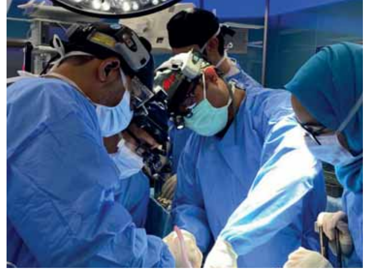
مسقط - الغمانية

نجح المستشفى السلطاني، بالتعاون مع مستشفى خولة، والمركز العماني لتنظيم التبرع بالأعضاء والأنسجة البشرية وزراعتها، في إجراء عملية متكاملة للتبرع بالأعضاء من مريض أعلن عن وفاته دماغياً، أسهمت في إنقاذ حياة أربعة مرضى، بعد الاستفادة من القلب والكبد والكليتين، في واحدة من العمليات الوطنية التي تعكس مستوى التنسيق والكفاءة التي تتمتع بها المنظومة الصحية في سلطنة عُمان. وبدأت رحلة هذا الإنجاز في مستشفى خولة، حيث استقبل المستشفى مريضاً أثبتت وفاته دماغياً وفق البروتوكولات الطبية المعتمدة، لتباشر الفرق الطبية المختصة، بالتنسيق مع المركز العماني لتنظيم التبرع بالأعضاء والأنسجة البشرية وزراعتها، بإجراء تقييم الحالة واستكمال جميع المتطلبات الطبية والقانونية والأخلاقية المعتمدة، والتواصل مع ذوي المتبرع، الذين جسدوا بموافقهم على التبرع بأعضاء، فيديهم أسمى معاني العطاء والإنثار، ما يحين أربعة مرضى فرصة جديدة للحياة. وأجرى المركز، بالتعاون مع الفرق الطبية في مستشفى خولة والمستشفى السلطاني، سلسلة من الفحوصات السريرية والمخبرية والمناعية لتقييم صلاحية الأعضاء، ودراسة مدى توافقها مع المرضى المرشحين على قوائم الانتظار. وفق معايير علمية دقيقة تضمن أعلى مستويات السلامة والجودة ونسب النجاح. ونظراً لما تتطلبه عمليات زراعة القلب المتخصصة تنفيذ عمليات استئصال الأعضاء وزراعتها ضمن منظومة عمل متكاملة اتسمت بالدقة العالية والتنسيق المحكم، بما يضمن المحافظة على حيوية الأعضاء وتقليل الزمن الفاصل بين استئصالها وزراعتها. وشارك في هذا