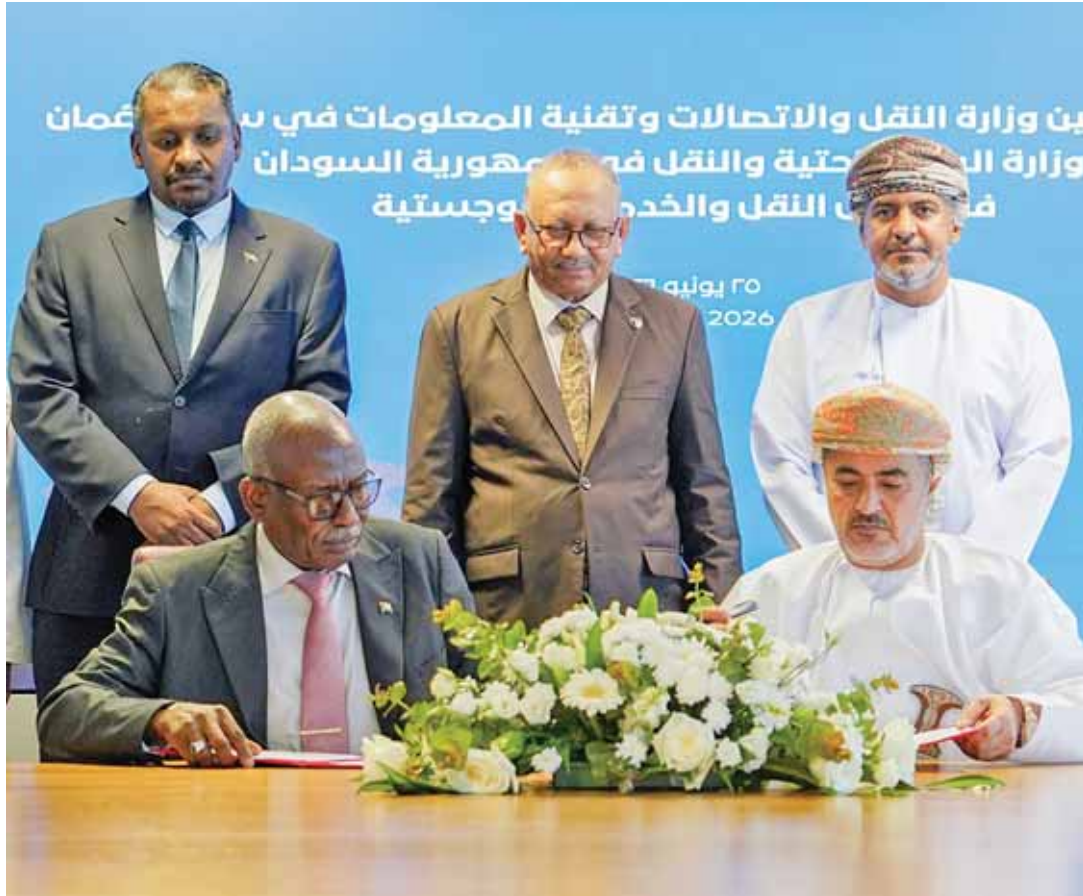
مسقط - ش. العماني

وقعت سلطنة عُمان والجمهورية السودانية الخمس، مذكرة تفاهم تهدف إلى تعزيز التعاون المشترك في مجالات النقل والخدمات اللوجستية والسكك الحديدية والموانئ والشؤون البحرية، إلى جانب التدريب وتبادل المعلومات والخبرات الفنية بين الجانبين. وقع المذكرة من الجانب العماني معالي المهندس سعيد بن حمود المعولي وزير النقل والاتصالات وتقنية المعلومات، فيما وقعها من الجانب السوداني معالي سيف النصر التجاني وزير البنية الأساسية والنقل. وتأتي المذكرة في إطار حرص البلدين على تطوير الشراكة الثنائية وتوسيع آفاق التعاون في القطاعات المرتبطة بالنقل والخدمات اللوجستية، بما يسهم في دعم التنمية الاقتصادية وتعزيز كفاءة منظومة النقل.