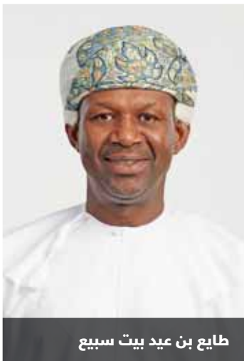
طابع بن عيد بيت سبيع