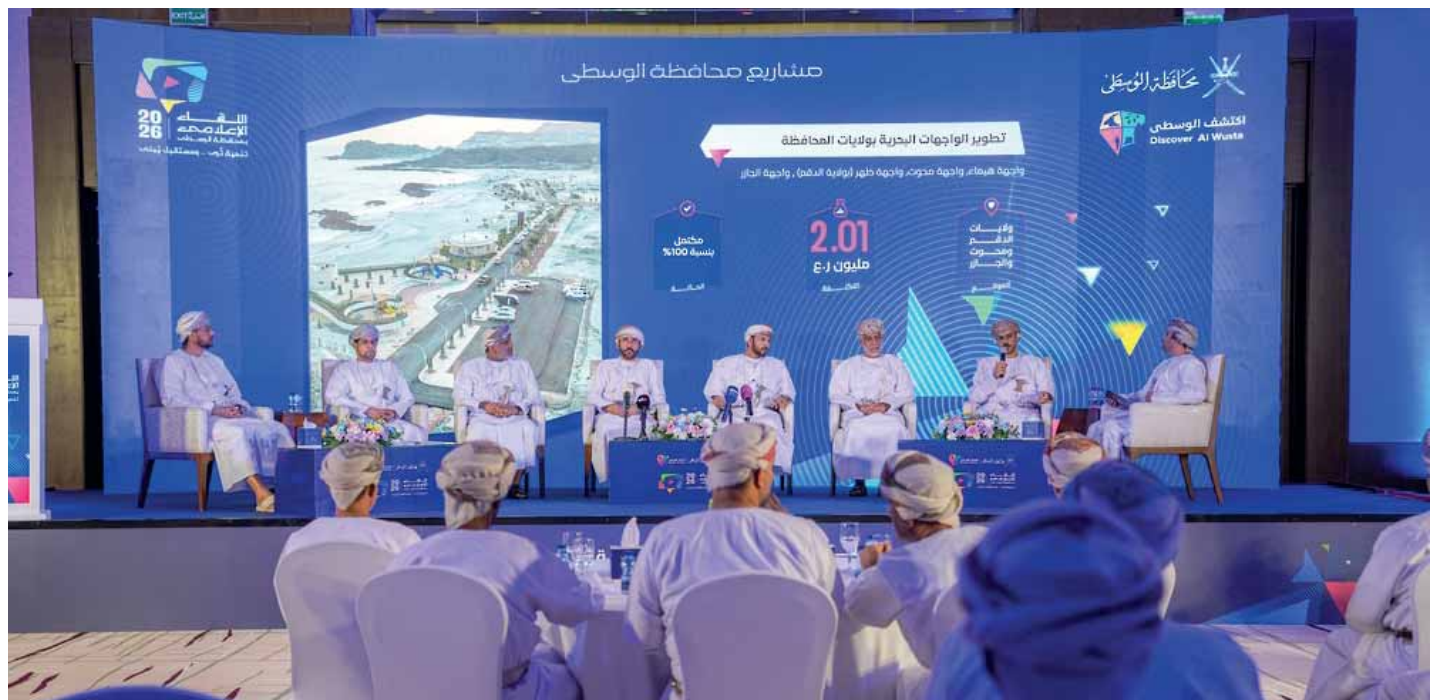
الدم - الفهاليّة

تنفذ محافظة الوسطى أكثر من 173 مشروعًا لعدد من المشاريع التنموية والاقتصادية والسياحية بتكلفة إجمالية تتجاوز 37.5 مليون ريال عُمان، موزعة على ولايات المحافظة، بما يعكس حجم الحراك التنموي واتساع نطاق المشاريع الخدمية جاء استعراض هذه البيانات خلال اللقاء الإعلامي لمحافظة الوسطى في ولاية الدم أمس، تحت شعار تنمية ترقى.. ومستقبل يبنى.