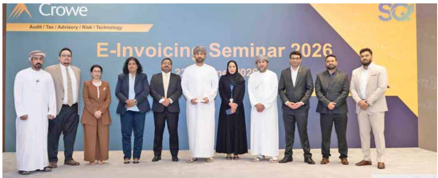
مسقط - ك

نظمتها جمعية المصارف العُمانية بتاريخ 22 يونيو الجارى، كما قدم الفريق ورقة عمل أخرى ضمن ندوة الفوترة الإلكترونية التي نظمتها مؤسسة Crowe، كذلك شارك الفريق في قمة التقنيات الضريبية والفوترة الإلكترونية التي نظمتها مؤسسة Fortinus، والتي شهدت مشاركة عدد من مزودي خدمات الفوترة الإلكترونية وممثلي الشركات الخاضعة للضريبة. كما شارك مدير مشروع الفوترة