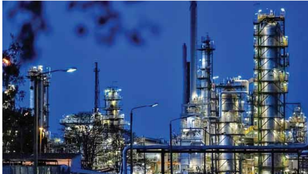
سلفافورة - العُمانية

ارتفعت أسعار النفط أمس بعد تبادل الضربات لأيام بين الولايات المتحدة وإيران، مما سلط الضوء على هشاشة الاتفاق المؤقت لإنهاء الحرب بينهما وأبداً مرة أخرى تدفق شحنات الطاقة.