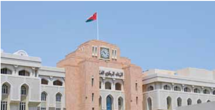
مسقط - العُمانية

(الريبو) على هذه الأذون هو 4ر25 بالمائة، بينما يبلغ سعر الخصم مع البنك المركزي على تسهيلات أذون الخزنة 4ر75 بالمائة. وتعد أذون الخزنة أداة مالية مضمونة لفترة قصيرة الأجل تصدرها وزارة المالية لتوفير منافذ استثمارية للبنوك التجارية المرخصة، حيث يقوم البنك المركزي العُمانى بدور مدير الإصدار لهذه الأذون.